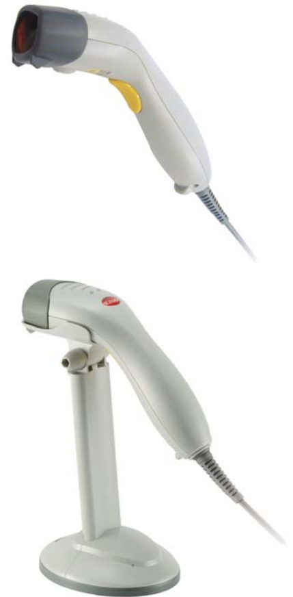
ハンドフリースタンド